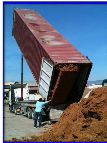
scarico container ribaltabile

Le informazioni sopra riportate sono state ottenute mediante le nostre conoscenze, elementi agronomici oggi consolidati, costanti controlli di qualità e alla collaborazione con i nostri clienti, ci riserviamo comunque il diritto di introdurre modifiche qualora si riscontrassero delle variazioni. La Mundial de Coco SRL non può essere ritenuta responsabile per le conseguenze avverse derivanti da un utilizzo improprio di questo prodotto.